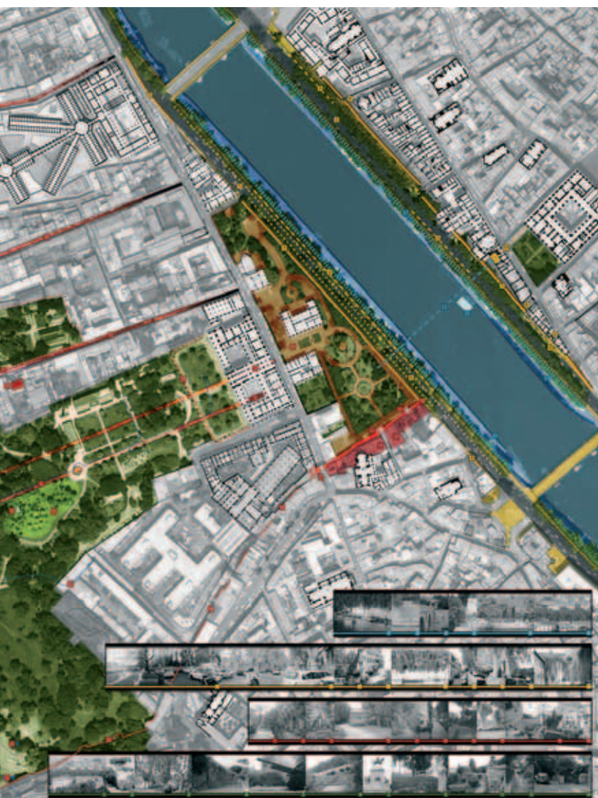
Tabola del progetto preliminare per la valorizzazione delle pendici dell'invaso fluviale